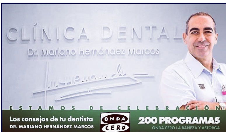
Cartel del programa semanal de radio en Onda Cero La Bañeza.