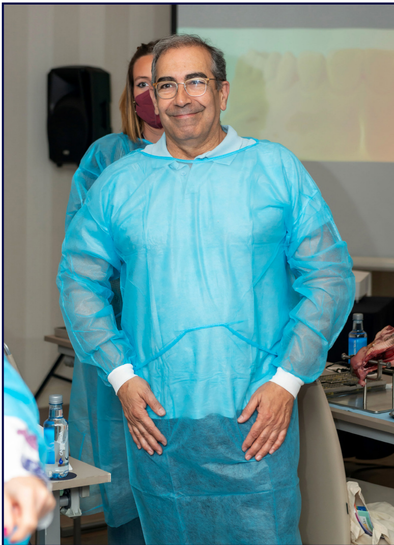
En uno de sus cursos de formación.