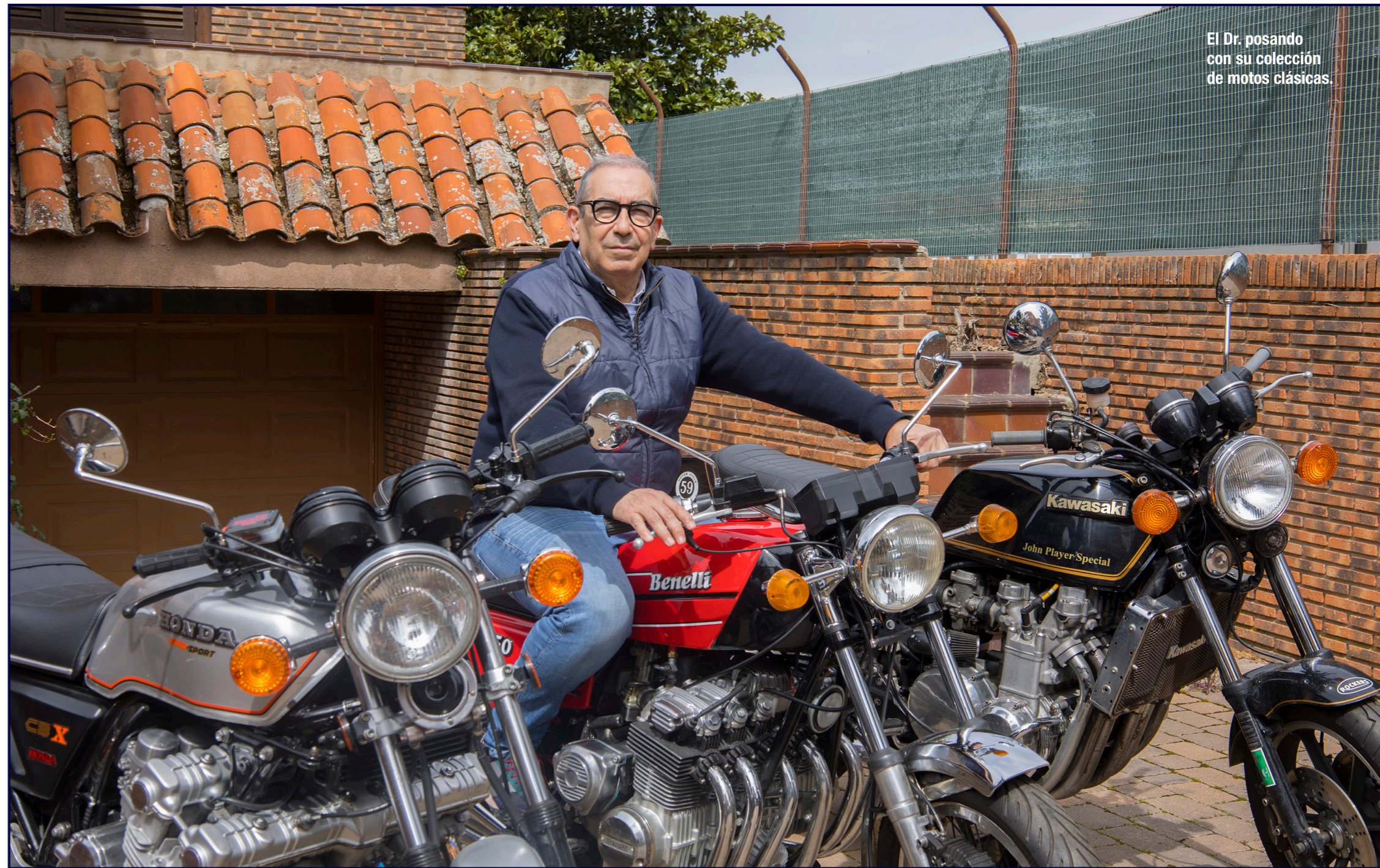
El Dr. posando con su colección de motos clásicas.