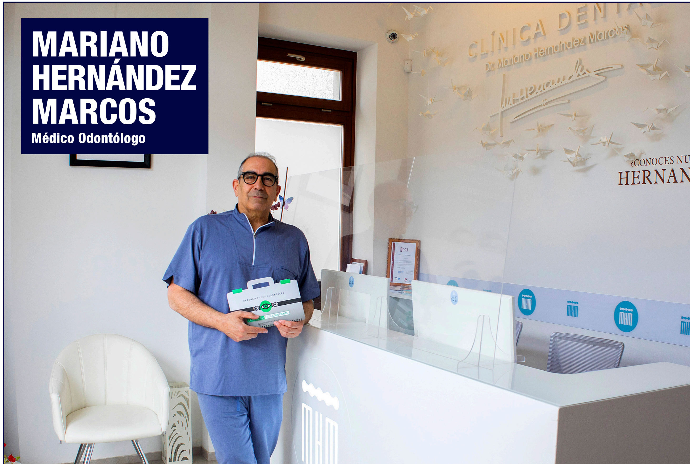
Bajo estas líneas, el Dr. en su despacho de la clínica y con uno de sus equipos de microscopios.