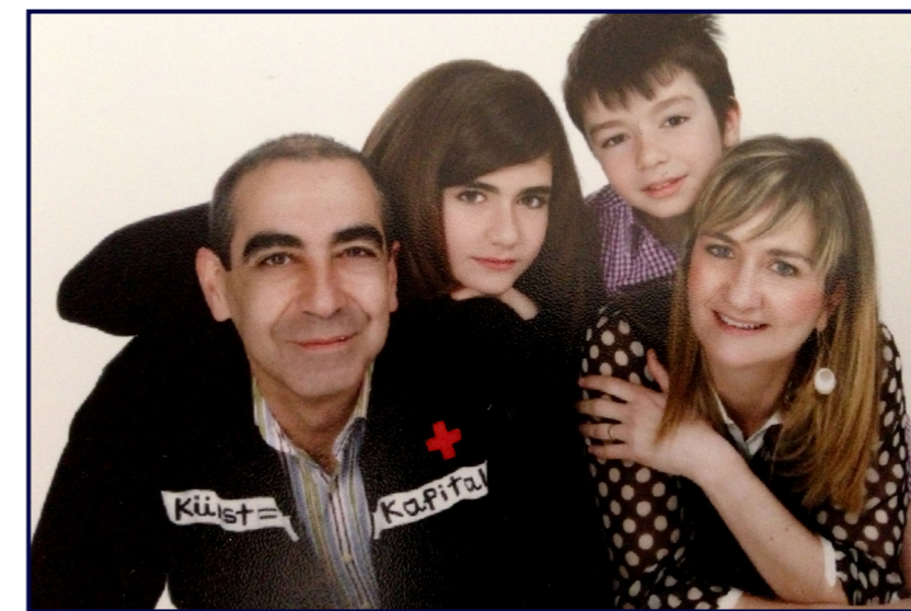
Con su familia, su mayor pasión.

R.- Sí, es la primera vez que se realiza un estudio así y desde aquí quiero agradecer a todos los colegios y colegiados que han colaborado en dicho estudio y han entendido la importancia del mismo. En España no teníamos ninguna referencia de