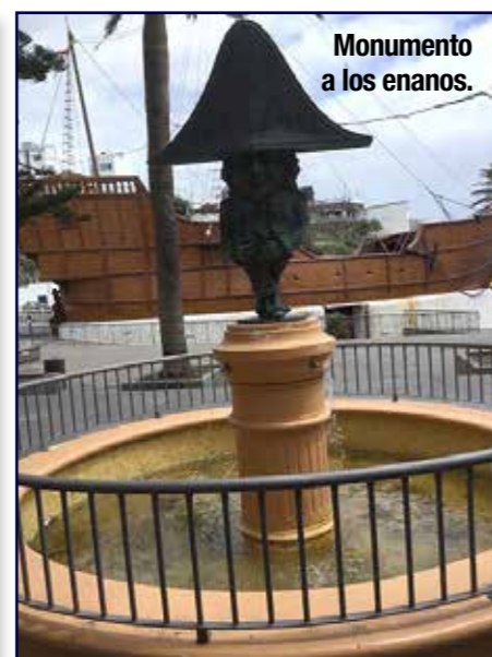
Monumento a los enanos.

nio dimos un gran paseo. Cerca el Teneguía, próximo al mar, fue uno de los últimos que erupcionó en 1971. Desde entonces hasta estos días en que escribo este reportaje hubo silencio volcánico. Hace una semana comenzaron a rugir y la lava se expulsó con fuerza, avanzando como en un río que arrasaba y engullía todo lo que encontraba a su paso. Las casas de los habitantes de estas comunidades fueron destruidas por el fuego y vimos la lava avanzando inexorablemente sobre vidas y cultivos. Afortunadamente, hasta el momento en que escribo estas líneas, no ha habido que lamentar muertes, pero las pérdidas económicas han sido cuantiosas.