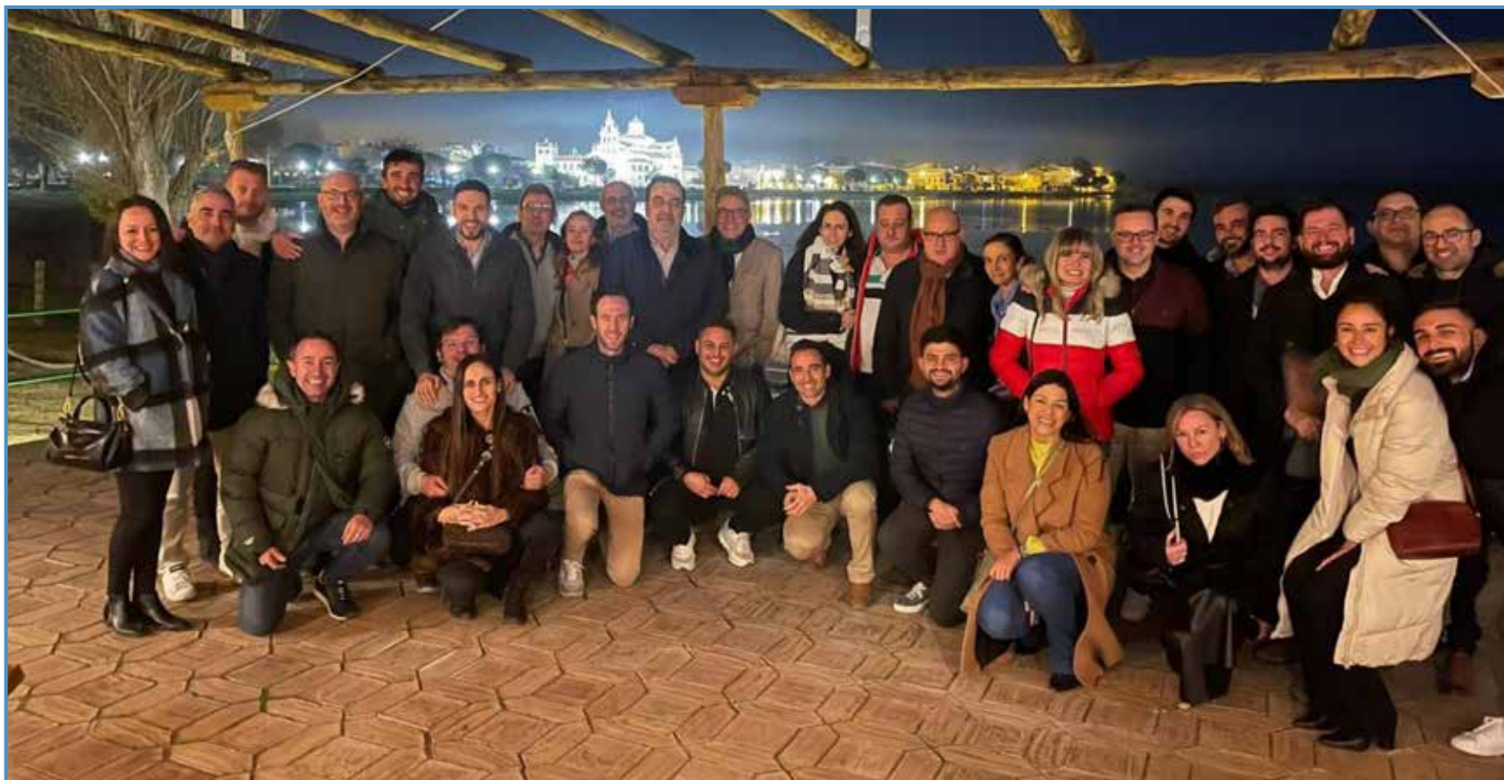
2023. En EL Rocío, un encuentro científico.