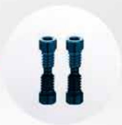
2 TORNILLOS PROTÉSICOS