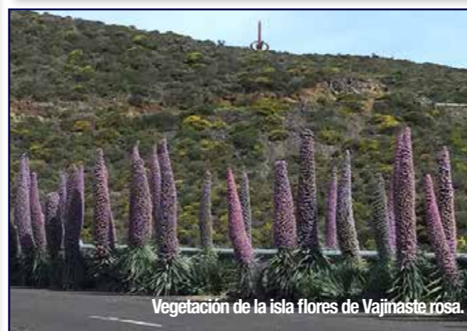
Vegetación de la isla flores de Vajinaste rosa.