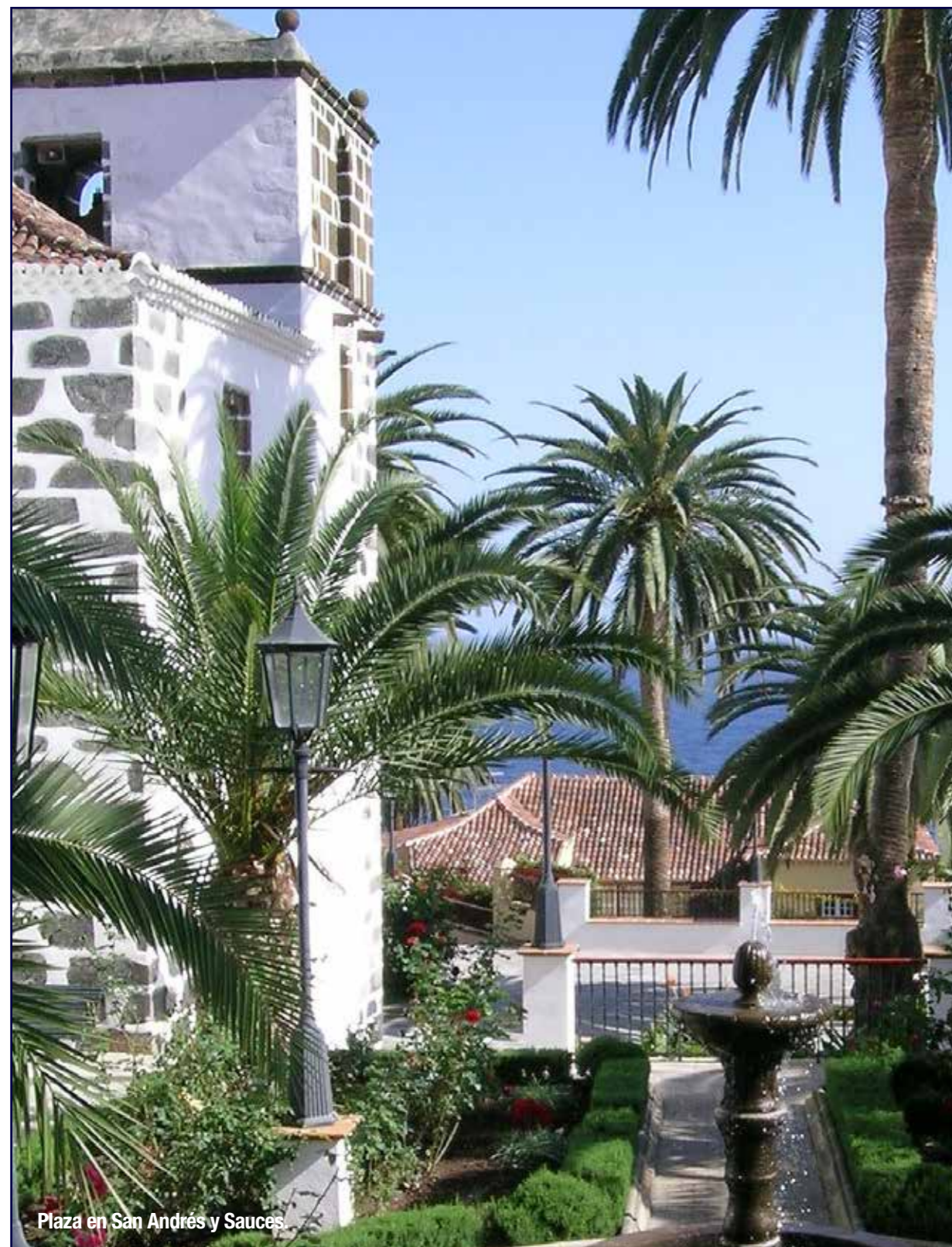
Plaza en San Andrés y Sauces.