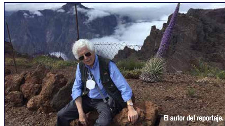
El autor del reportaje.