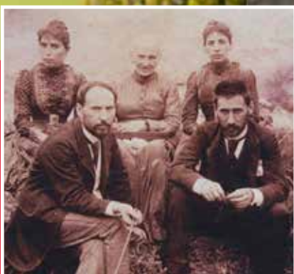
PEDRO RAMÓN Y CAJAL Catedrático en Cádiz y Zaragoza