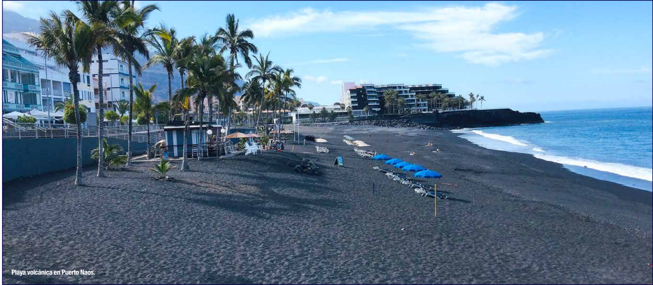
Playa volcánica en Puerto Naos.

de se celebra la festividad de este santo, así como otras como la bajada de la Virgen de las Nieves y la danza de los enanos.