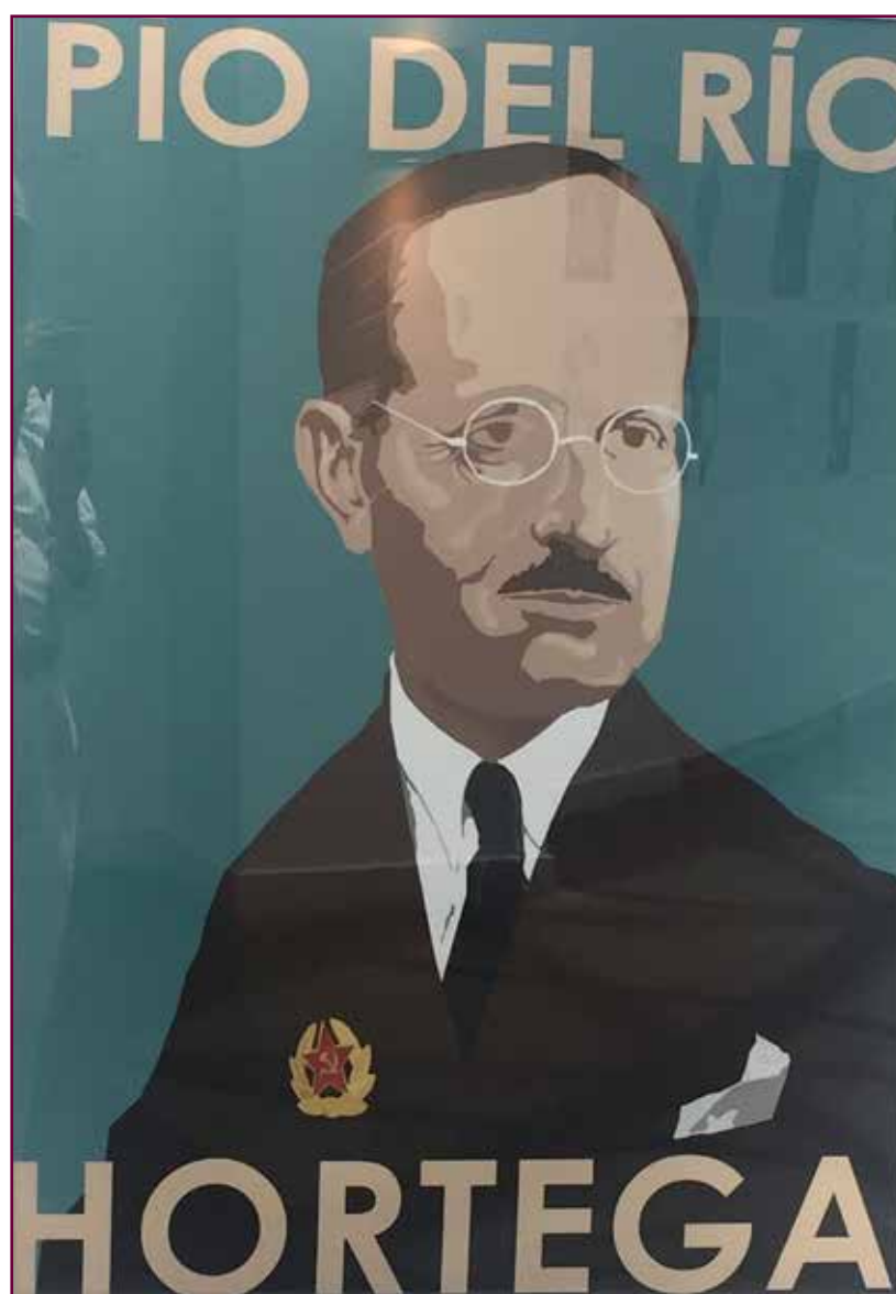
Don Pío Río Hortega.

tencionado, que servía de amanuense a Cajal tanto en su casa como en el laboratorio. Un dogo terrible que enseñaba los dientes gruñendo o mordía a cualquiera que no fuese su dueño o