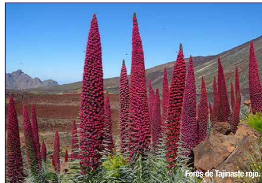
Fores de Tajinaste rojo.