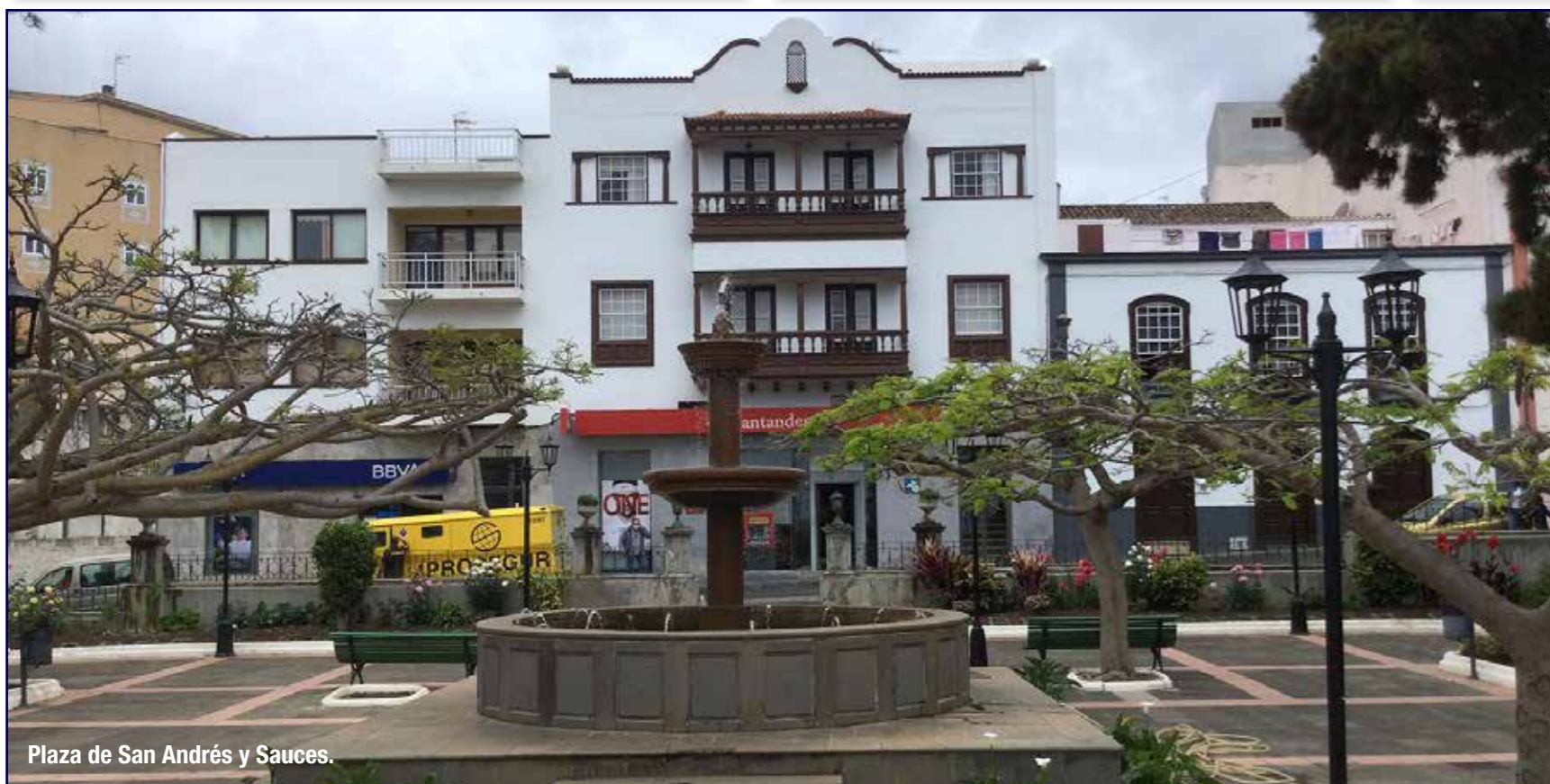
Plaza de San Andrés y Sauces.