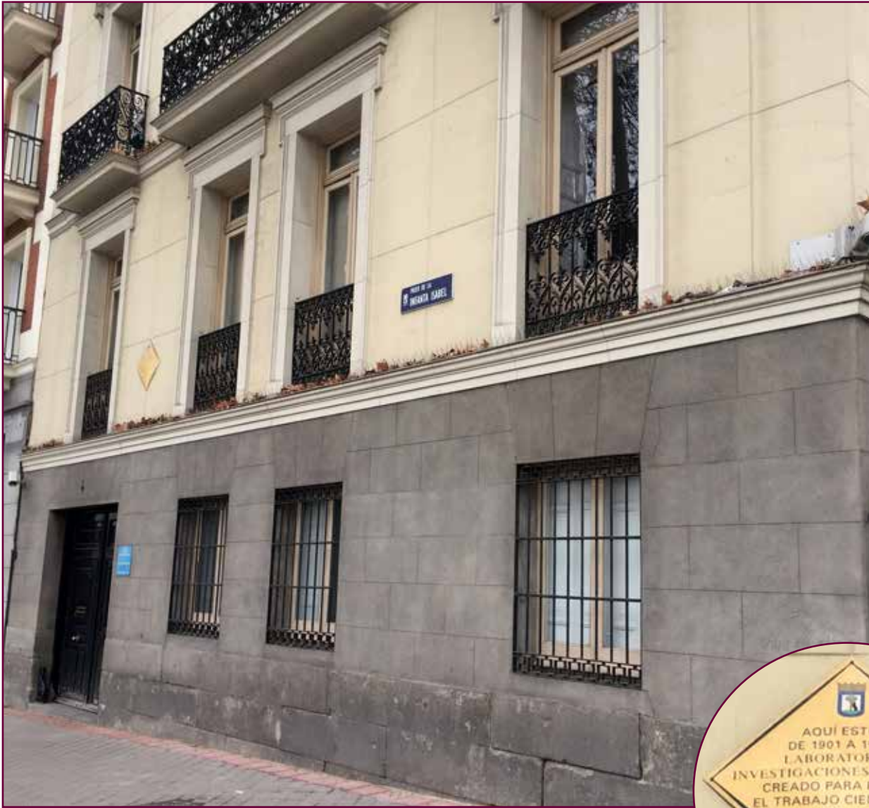
Paseo de la Infanta Isabel. Laboratorio de Investigaciones Biológicas. A la derecha imagen con el detalle de la placa conmemorativa.