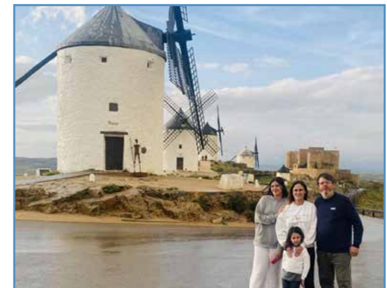
2024, Castilla la Mancha. Vacaciones en familia.