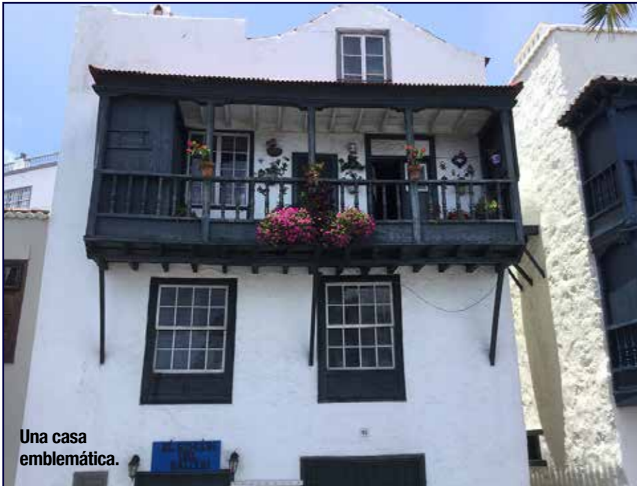
Una casa emblemática.

De especial belleza fue el paseo por la plaza de san Francisco don-