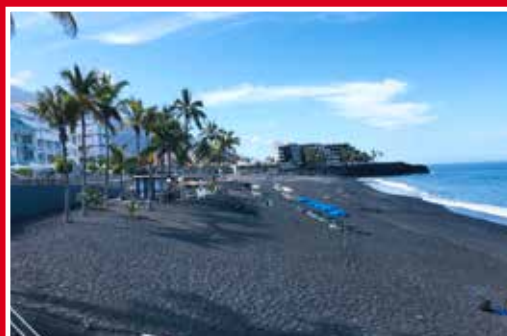
LA PALMA, LA ISLA BONITA QUE LLORA CON DESCONSUELO (II)