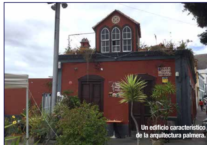
Un edificio característico de la arquitectura palmera.

No volverá la vida de antes. Solo tendrán recuerdos y nostalgias de un pasado feliz que fue