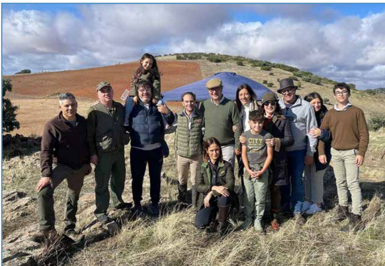
2023, Ciudad Real. Con parte de su equipo y amigos.

tor es una de las cosas que más me apasionan, participo junto a Jesús como copiloto en los campeonatos de 4x4 Extremo - Iberian King.