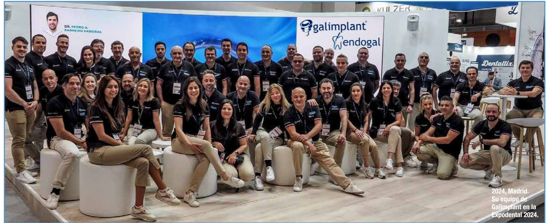
2024, Madrid. Su equipo de Galimplant en la Expodental 2024.

“Para mi Galimplant es mi familia, aquí en esta casa he construido un hogar en el que además tengo la suerte de tener a mis mejores amigos trabajando conmigo.”