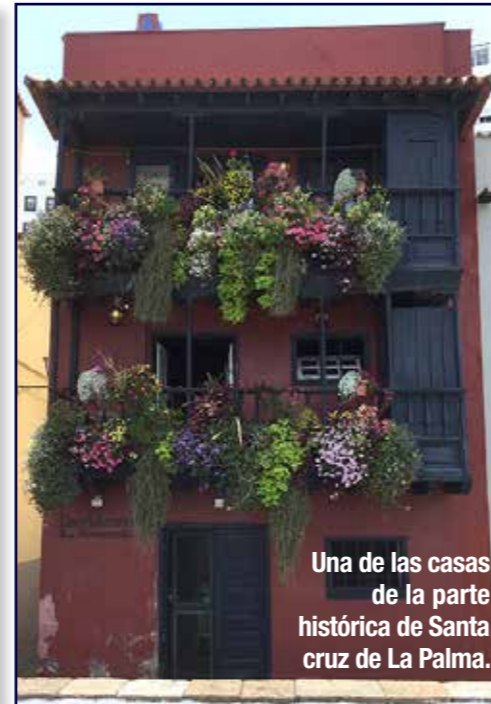
Una de las casas de la parte histórica de Santa Cruz de La Palma.