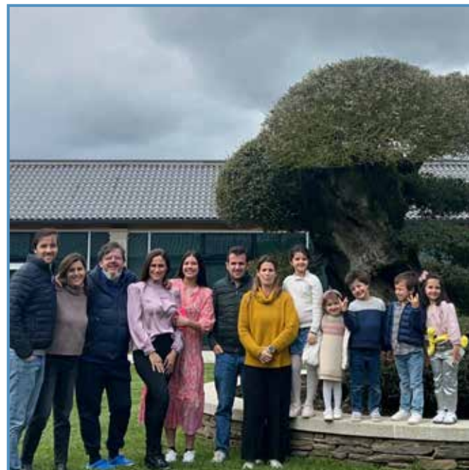
2024. Con su familia y amigos en Sarria.

las quedadas con los amigos, lo hacemos a menudo. Cuando hicimos nuestra casa, la principal preocupación fue tener una mesa muy grande para estar todos juntos.