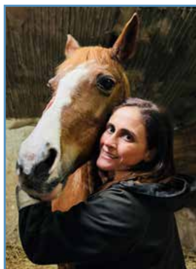
Uno de sus hobbies, los caballos.

La odontología analógica tiene una secuencia que puede acumular imprecisiones, sin embargo, esta tecnología digital ha llegado para quedarse y evoluciona a un ritmo imparable. Tenemos los escáneres, softwares de planificación, softwares de