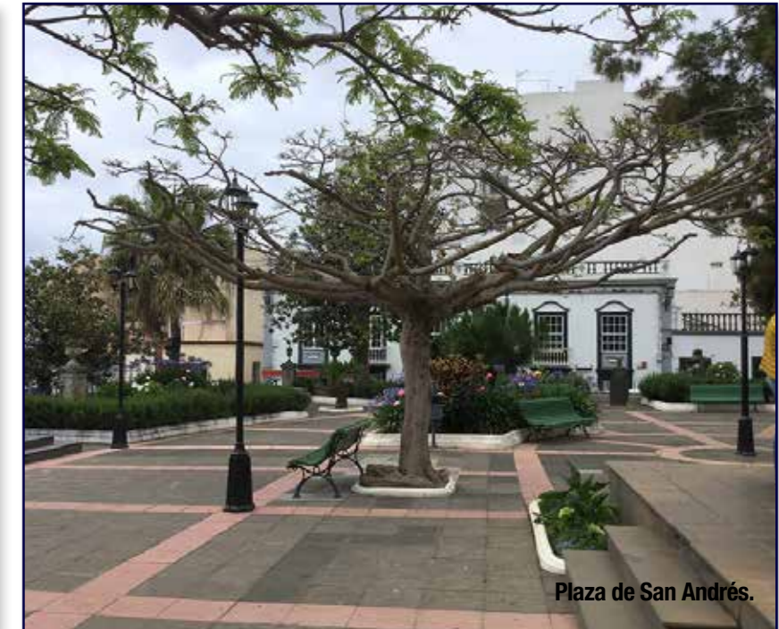
Plaza de San Andrés.