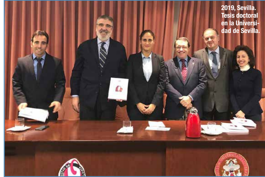
2019, Sevilla. Tesis doctoral en la Universidad de Sevilla.

Aquí, en conjunto con mi equipo, realizamos todo el desarrollo del producto y todas las facetas vinculadas al mismo, que no son pocas. Desarrollamos los implantes, los pilares o el tratamiento de superficie, por ejemplo. También trabajamos profundamente en I+D+I y, yo personalmente, me ocupo de la coordinación, el de-