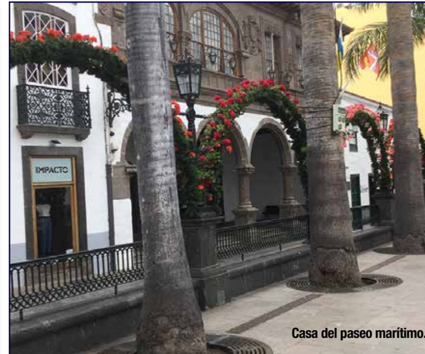
Casa del paseo marítimo.