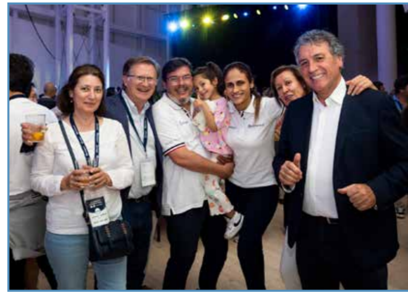
Uno de los Congresos "Sigamos Sumando Juntos" organizado por Galimplant.

R.- Bueno aún es temprano para saber eso. India es muy pequeña pero la mayor, África, tiene claro que quiere ser dentista, aunque la vida da muchas vueltas y al final serán lo que ellas quieran ser. Lo que tengo claro es que llegarán tan alto