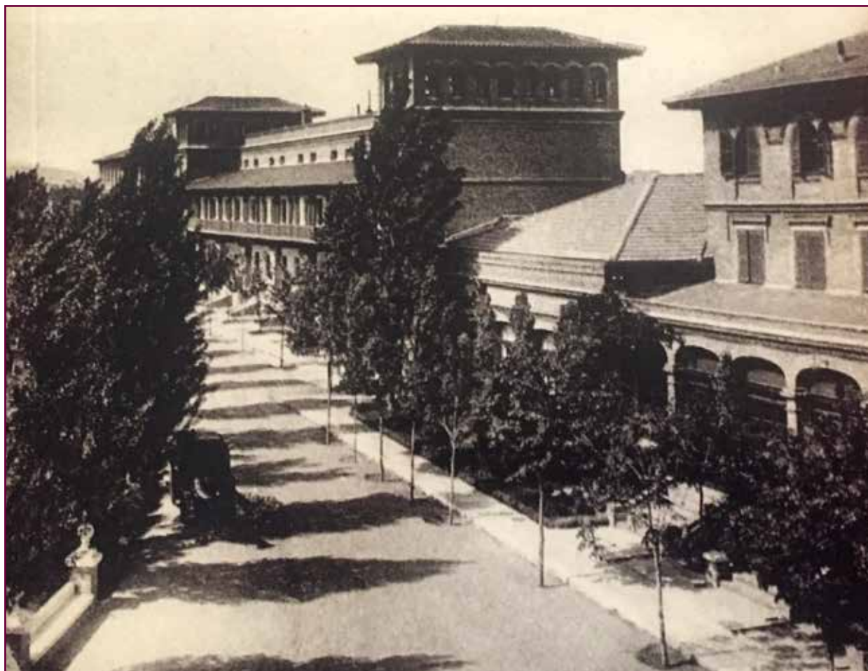
Residencia de Estudiantes, pabellón Transatlántico.

La consecuencia fue que don Pío tuvo que trasladarse de forma inmediata a la Residencia de Estudiantes, a la planta baja del pabellón llamado <Transat-