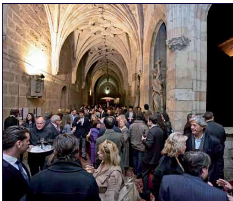
El XXXII Congreso de AEDE ha contado con la asistencia de 450 profesionales.