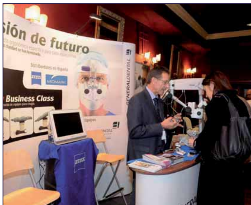
Las casas comerciales han presentado en León los últimos avances en materiales y aparatología para endodoncia.