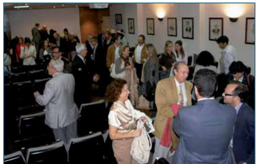
Vista general de los asistentes a la apertura del curso académico.

bienestar del paciente y, cómo no, seguir de manera constante con el estudio y la formación continuada”.