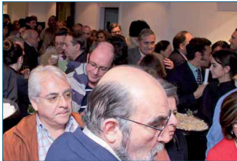
Tras la conferencia, los asistentes disfrutaron de un cóctel.