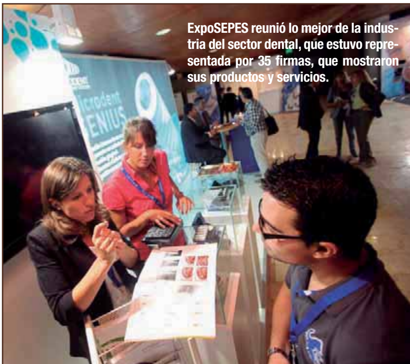
ExpoSEPES reunió lo mejor de la industria del sector dental, que estuvo representada por 35 firmas, que mostraron sus productos y servicios.